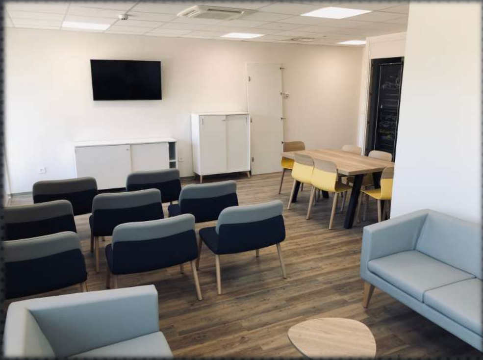
Salle détente TV