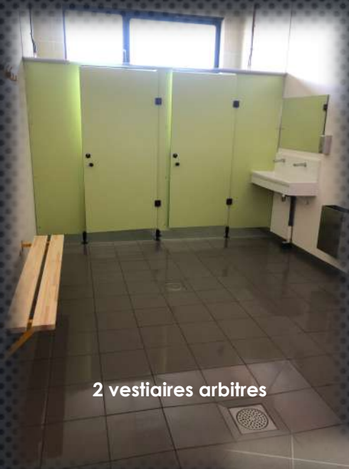
2 vestiaires arbitres