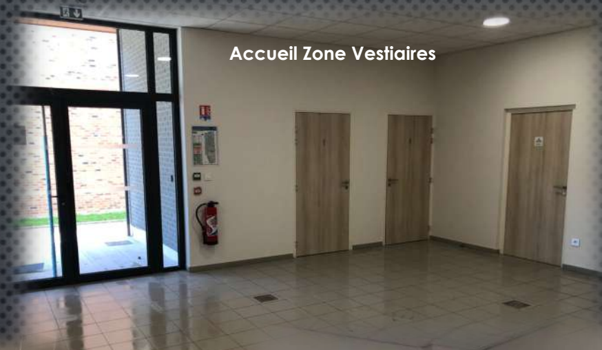
Accueil Zone Vestiaires