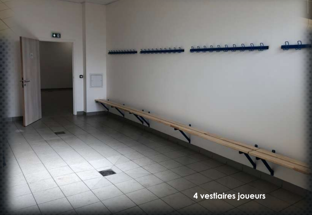
4 vestiaires joueurs