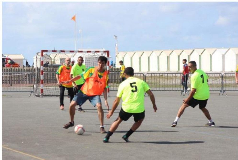
Le football s'installe sur le front de mer dès 10h.

Après deux éditions réussies de la fête du futsal en plein air, le club de Cayeux-sur-Mer (Somme) associe cette année l'événement à la tournée d'été de la Ligue de football des Hauts-de-France . Rendez-vous le 17 août 2018 pour profiter d'une pléiade d'animations gratuites.